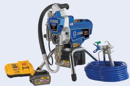
Classic 390 PC Cordless: Het solide werkpaard

De krachtigste lijn snoerloze spuittoestellen ooit gemaakt geeft u de vrijheid om elke klus sneller te spuiten