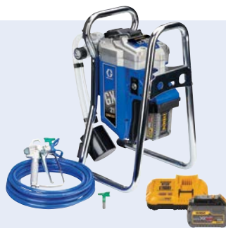
GX21 Cordless: The Goal-Getter